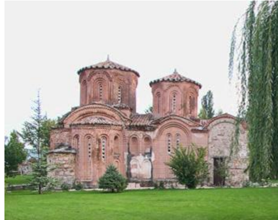
„Св. Богородица Елеуса“, во Вељуса