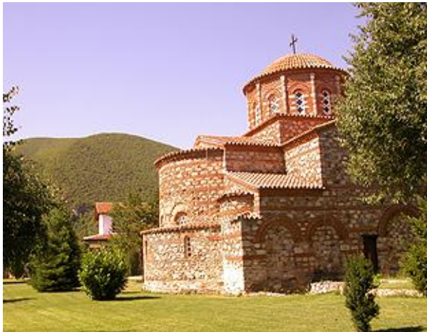
„Свети Леонтиј“ во Водоча

Во средината на декември 2013 година е пуштен е во употреба регионалниот пат со кој се поврзуваат селата Ангелци, Вељуса, Водоча и Баница долг 7,5 километри и ширина на коловозната лента од 5,5 метри со што е обезбедена современа патна врска со реномираните манастири „Св. Богородица Елеуса“, во Вељуса и „Свети Леонтиј“ во Водоча