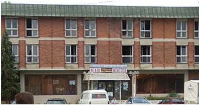
Хотел Македонија - Берово

Четири хотели, по два во Берово и во Пехчево, во моментот се градат во двете општини, со што се очекува значително подобрување на туристичката понуда на Малешевијата. Два хотела треба да бидат комплетно готови за оваа, а два за следната летна туристичка сезона, а и поранешниот хотел „Панорама“ доби нови сопственици.